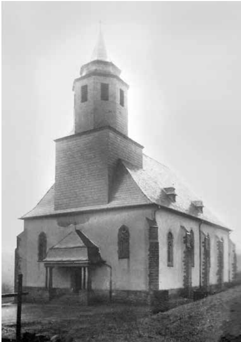
Die Kirche St. Wendalinus wurde am 21. Februar 1945 fast vollständig zerstört.

Der weitaus größte Schaden der von der Thunderbolt-Staffel herbeigeführt wurde blieb dabei eigenartigerweise vollständig unerwähnt. Mindestens eine Sprengbombe vom Kaliber 250 kg hatte die katholische Kirche St. Wendalinus auf dem Gänsberg in Dirmingen kurz vor 18:00 Uhr getroffen und fast vollständig zerstört.