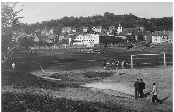
Der Sportplatz im Brühlpark

Etwa zur gleichen Zeit wurde im Brühl ein Sportplatz erbaut. Im Jahre 1954 bestritt der TV 04 Dirmingen vor 1500 Zuschauern ein Entscheidungsspiel im Feldhandball gegen den Rivalen aus Uchtelfangen. Die Dirminger Handballer konnten dieses besondere Spiel für sich entscheiden.