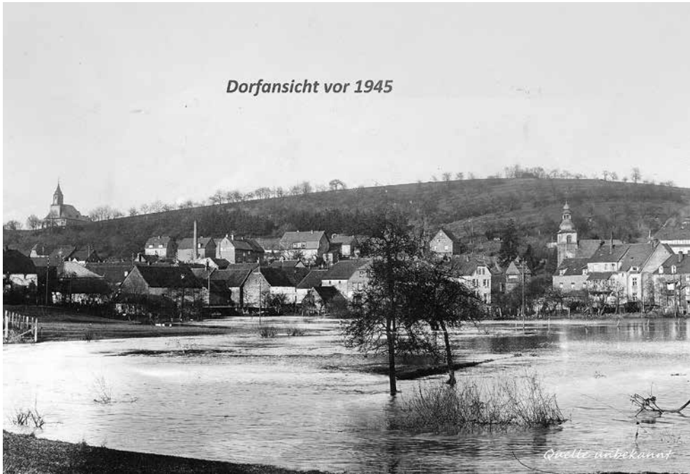
Die Dirminger Ortsmitte vor 1945

Beim Jahrhunderthochwasser im Saarland Ende Dezember 1947 waren auch Ill und Alsbach wegen Dauerregen weit über die Ufer getreten. Die komplette Ortsmitte stand damals unter Wasser. Die Menschen mussten auf schmerzhaft Weise erfahren, dass die beiden Bäche dem Dorf nicht nur Vorteile, sondern auch erhebliche Probleme bringen konnten.