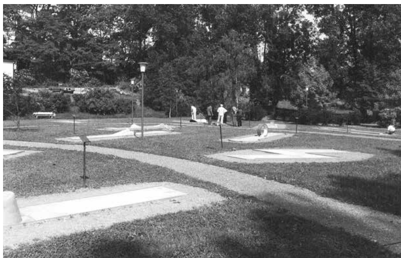
Die Minigolfanlage im Brühlpark

Der Vereinsring Dirmingen erbaute in den 1980er Jahren eine Minigolfanlage im Brühlpark. Mit dieser Anlage sollte der Park eine weitere Aufwertung erfahren. Die Minigolfanlage bestand aus 18 Bahnen die jeweils 12 m lang und 1,25 m breit waren. Ziel des Spiels war es, den Ball mit Hilfe eines Schlägers mit möglichst wenigen Versuchen in das Loch des Zielkreises zu bewegen. Neben der Minigolfanlage wurde eine Holzhütte für den laufenden Geschäftsbetrieb erbaut. Im Laufe der Jahre gab es immer wieder Beschwerden wegen unzureichender Pflege und mangelhafter Unterhaltung der Anlage. Auf Initiative des Heimat- und Verkehrsvereins Dirmingen schloss die Gemeinde am 21.07.1986 einen Werkvertrag mit einem Dirminger Bürger, der die Anlage regelmäßig mähen und pflegen sollte. Über viele Jahre bereicherte die Minigolfanlage im Brühlpark das Ortszentrum. Irgendwann verschwand jedoch das Interesse der Bevölkerung am Minigolf. Ende der 1980er Jahre wurde die Anlage geschlossen und später vollends entfernt.