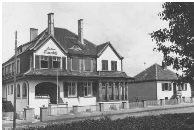
Das Landheim in den 30er Jahren

Zwei Diakonissinnen übernahmen die Leitung des Hauses.