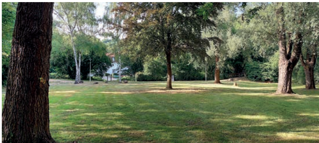
Der Brühlpark im Sommer 2022

Im Jahr 1992 wurden die Ill und ihre Nebenbäche in ein Förderprogramm des Bundes für gesamtstaatlich repräsentative Naturschutzgroßvorhaben aufgenommen. Mit der Illrenaturierung sollte die Landschaft um die Ill so naturnah wie möglich umgestaltet werden. Ziel war es außerdem, verloren geglaubte Tierarten wieder anzusiedeln. Im Jahre 1994 gelang die „Wiedereinbürgerung“ des Bibers. Heute ist er im Illtal längst heimisch geworden und fühlt sich auch an den Ufern von Ill und Alsbach sichtlich wohl. Im Jahre 2009 erklärte der Zweckverband Illrenaturierung seine Tätigkeit bezogen auf die Ill und ihre Nebenbäche für abgeschlossen. Fauna und Flora hatten sich bis dahin gut erholt. Der Natur, um den Zusammenfluss von Ill und Alsbach, geht es heute wieder gut.