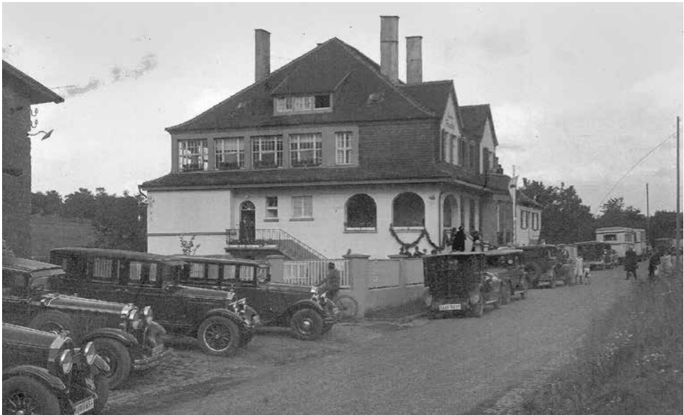
Das Landheim Frauenhilfe am Tag der Eröffnung

Die schlechte Nachkriegszeit mit Inflation und Wirtschaftskrise ließen dem schnellen Aufstieg den Niedergang folgen. 1928 war das Ende der Wiesbacher Mühle gekommen. Mernke verkaufte, die Familie verließ Wiesbach. Der Saarverband der Evangelischen Frauenhilfe erwarb das Haus, um ein Erholungsheim für Frauen und Mütter mit ihren Kindern zu schaffen.