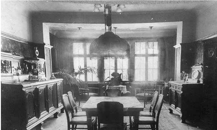
Innenaufnahme der Villa Mernke

Auch die Innenräume zeugten vom gewonnenen Wohlstand. „Eigenes elektrisches Licht, herrschaftliche Wohnräume mit den teuersten Möbeln und Teppichen, eigene Hauslehrerinnen und Köchinnen, Müller und Bedienstete, Bäcker und Bäckerei, Lastwagen und vieles mehr dürfen hier angeführt werden“, so Schmitz.