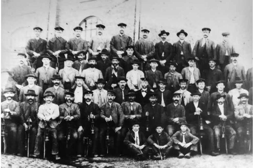
Wiesbacher und Humeser Bergleute um 1900 vor der Grube Göttelborn

Das Unternehmen hatte 1927 und auch 1948 mit mehr als 4500 Mitarbeitern die höchste Beschäftigtenzahl. 1) Viele davon kamen aus den genannten Orten.