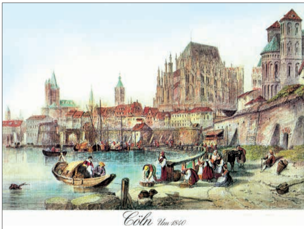
Der Kölner Dom um 1840

Im 19. Jahrhundert vollzogen sich größte Umwälzungen der Gesellschaft in allen Bereichen. Mit der Industrialisierung und dem Auftreten der Massenarmut, der Massenauswanderung und dem Kampf um Modernismus und Autokratie in Kirche und Politik entstanden ganz neue, vorher unbekannte gesellschaftliche Konfliktfelder. Es kam zu immer mehr Differenzen zwischen Religion und Wissenschaft, Glaube und Vernunft. Die deutsche Romantik, die mit dem Allroundgenie Goethe (1749-1832) begann, war ein letzter Versuch, so etwas wie eine „Einheit der Welt“ zu schaffen. Die Romantiker hatten es geschafft, seit 1814 den seit der Reformation