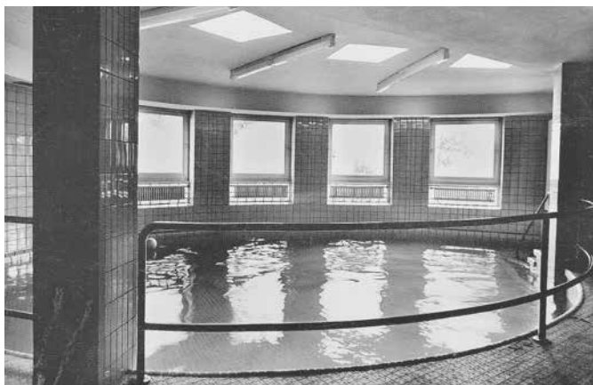
Das 1966 erbaute Therapie-Schwimmbad

Die Kuren basierten nun auf einem ganzheitlichen frauenspezifischen Ansatz. Dabei lag der Fokus weniger auf einzelnen Symptomen und Leiden als „vielmehr auf den Systemkonstellationen und deren vielschichtigen Ursachen. Körperliche, psychische und soziale Aspekte von Krankheiten und Beschwerden werden integriert behandelt. Die gesamte Lebenssituation der Frau ist Ausgangspunkt aller medizinischen und therapeutischen Maßnahmen. Die