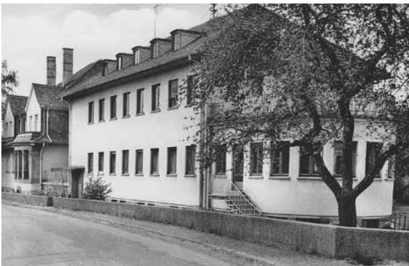
Der 1955 errichtete Erweiterungsbau

Die Gemeinschaft der Diakonissinnen war kein traditioneller Orden im katholischen Sinn, sondern eine protestantische Gemeinschaft, die sich der Diakonie, der Frauenbildung und der sozialen Arbeit widmete. Sie lebten in einer Form des Zölibats, jedoch nicht unbedingt lebenslang. Einige lebten in Ehelosigkeit, während andere verheiratet waren.