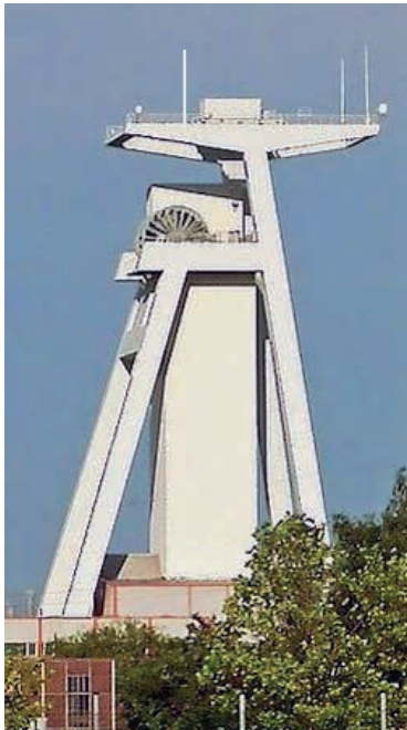
Der Schacht vier in Göttelborn, Symbol einer verfehlten Kohlepolitik.

Der Anfang der 90er Jahre gegrabene Schacht vier, dessen Fördergerüst 90 m in die Höhe ragt und die Bergarbeiter bis 1160 m tief in die Erde bringen konnte, wurde mit einem 70 m dicken Betonpfropfen verschlossen.