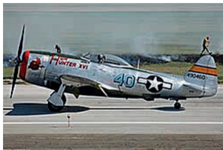
Die einsitzige Thunderbolt P-47 D war das meistgebaute US Jagdflugzeug

Das Ende dieser fürchterlichen Bomben-Angriffe war damit aber noch nicht erreicht. Drei Tage später, am 15. März, war Habach das Ziel von acht Thunderbolt P-47 D Kampfflugzeugen. Sie waren um 7:10 Uhr in St. Dizier im Nordosten Frankreichs gestartet und warfen um 8:50 Uhr 16 RDX Sprengbomben vom Kaliber 250 kg aus einer Höhe von 1400 m bei klarem Wetter und ungehinderter Sicht auf das Dorf. Dabei kamen zehn Ortseinwohner zu Tode.