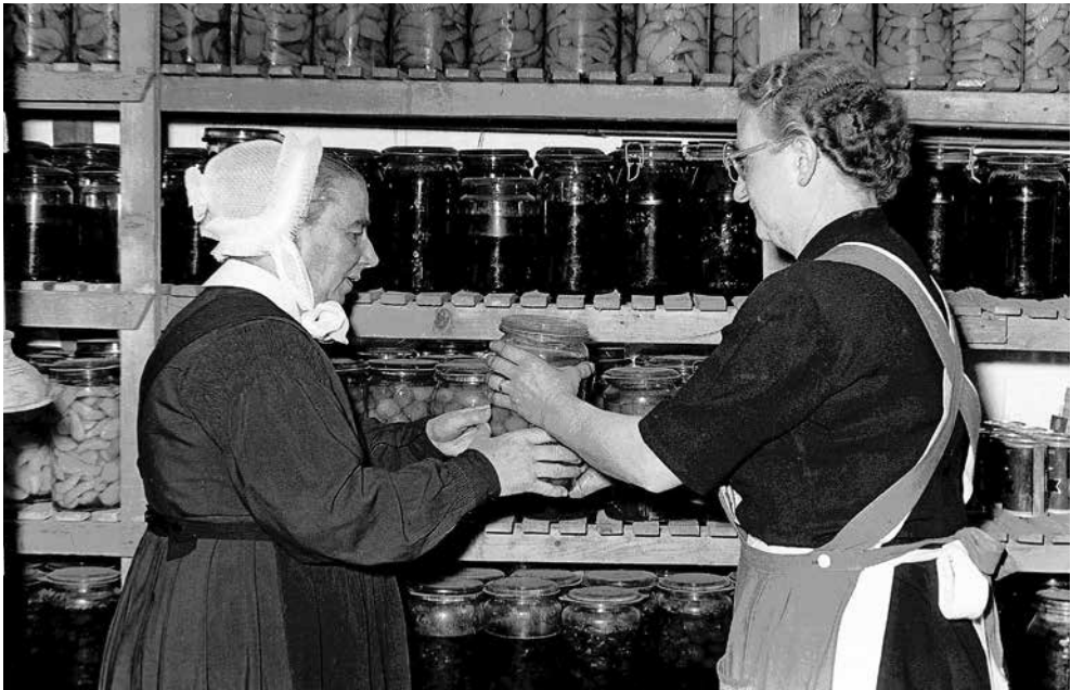
Diakonissinnen von Kaiserswerth in ihrer Tracht, Selbstversorgung war fester Bestandteil des Hauses