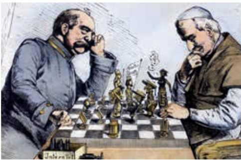
Karikaturistische Darstellung des Kulturkampfes: Bismarck und Papst Pius IX. beim Schachspiel

Am 21. Mai 1872 wurde als Selbsthilfverein gegen den Kulturkampf in Mainz der „Mainzer Katholikenverein“ gegründet. Mit ihm hatte sich der deutsche politische Katholizismus eine Organisation geschaffen, die die „Verteidigung der Freiheit und Rechte der katholischen Kirche“ auf ihre Fahnen geschrieben hatte. Am 8. Juli 1872 trat der „Mainzer Verein“ mit einem Aufruf „An die Katholiken Deutschlands“ erstmalig an die Öffentlichkeit. Darin wurden alle katholischen Männer zur Verteidigung und Abwehr der kirchenfeindlichen Bestrebungen in Staat, Presse und Öffentlichkeit aufgerufen. Nach dem Wahlspruch „für Gott und Vaterland“ sollten die Katholiken ihre Stimmen auch politisch zur Geltung bringen und die katholischen Interessen bei den Regierungen einfordern. Man protestierte gegen die Politik der Nationalliberalen und den „Protestantenverein“. 1)